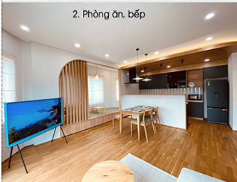
2. Phòng ăn, bếp