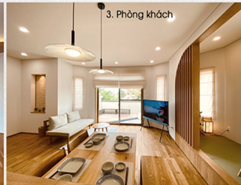
3. Phòng khách